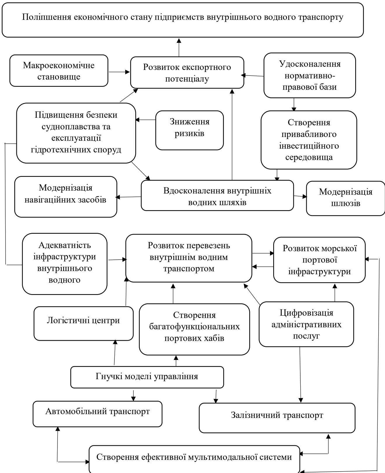
Рис.3. Умови збалансованого розвитку підприємств внутрішнього водного транспорту